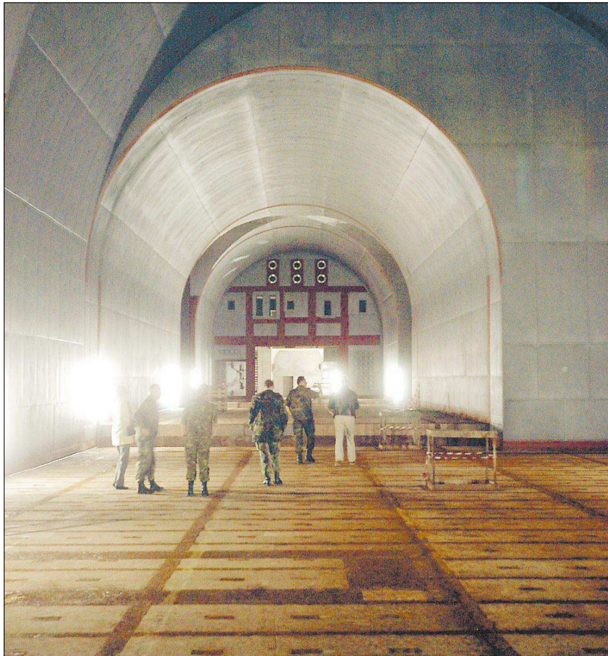
Acht bis zehn Meter hoch und fast genauso breit sind die Stollen des „Doms“. Hierhin wäre bei einem weiteren Ausbau des zweiten Stollens das so genannte Operation Center aus Stollen I umgezogen.

Was die Versorgung mit Trinkwasser betrifft, war die Nato gut vorbereitet. Ein eigener, 84 Meter tiefer Brunnen habe immer Wasser „mit sehr guter Qualität“ geliefert, lobt Habermehl. Ein Notstromaggregat aus Schiffsmotoren hätte Energie für die Wasserpumpen und Belüftung geliefert. 13.000 Kubikmeter Luft wurden pro Stunde in Friedenszeiten reingepumpt. Im Ernstfall, wenn Detektoren Giftgas oder Radioaktivität draußen entdeckt hätten, wäre auf Filterbetrieb umgeschaltet worden, in dem nur noch 9600 Kubikmeter pro Stunde geleistet werden konnten. Dutzende Aktivkohlefilterfässer mit je 200 Kilogramm Gewicht warteten glücklicherweise umsonst auf ihren Einsatz in der technischen Zentrale. „Im Filterbetrieb wäre es etwas stickig geworden, aber noch im Rahmen des Erträglichen“, erklärt Habermehl. Für die Zeit, in der keine Übung stattfand,