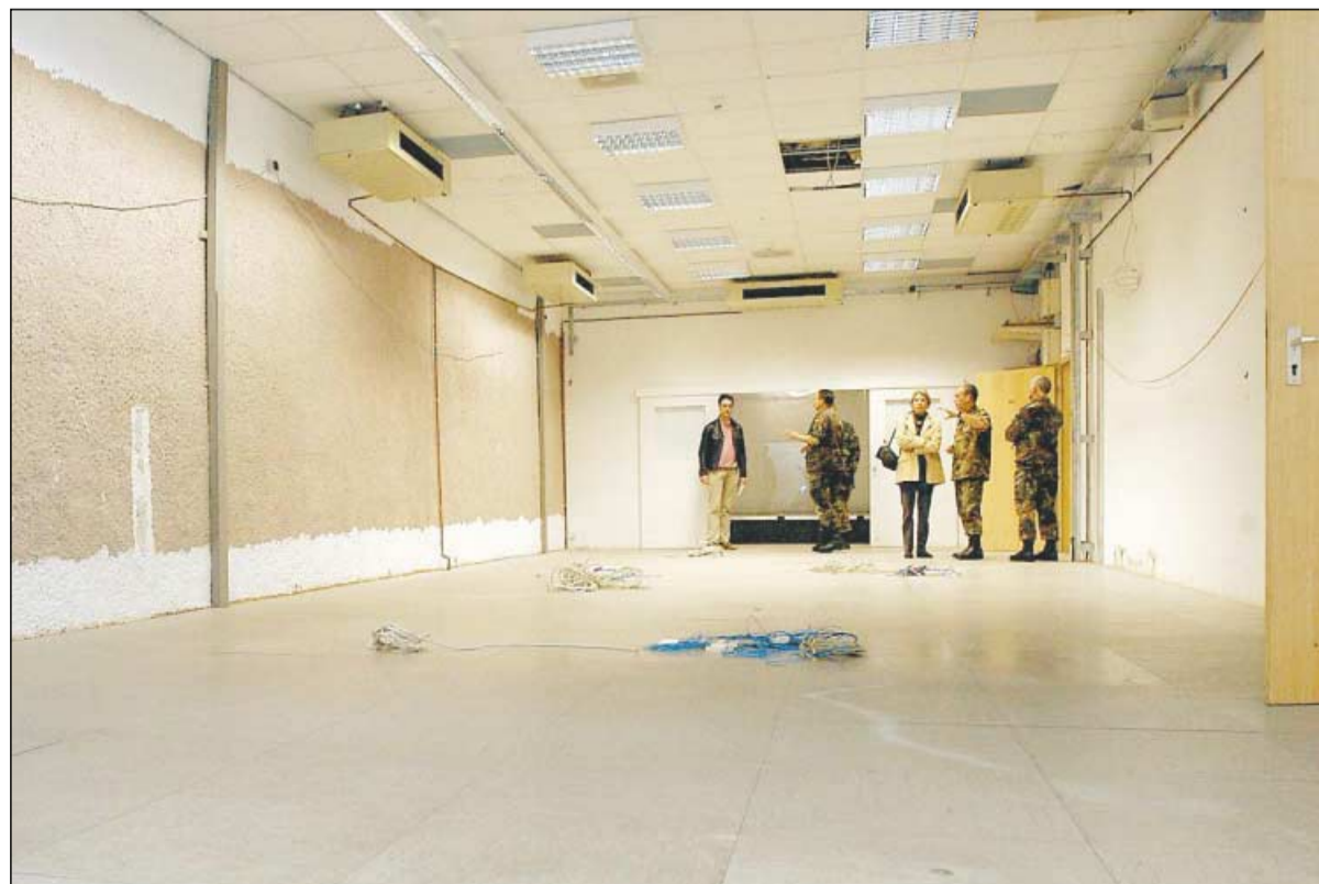
Im „Tactical Operation Center“ wären im Ernstfall die Nato-Luftstreitkräfte Nordeuropas koordiniert worden. Viel Platz war hier nicht, mancher Schreibtisch war gerade mal so breit wie die Computertastatur.

und Pirmasens schon von der Landkarte verschwunden wären, hätte in „Ruf II“ noch gearbeitet werden können, sofern den Bauingenieuren kein Rechenfehler unterlaufen wäre.